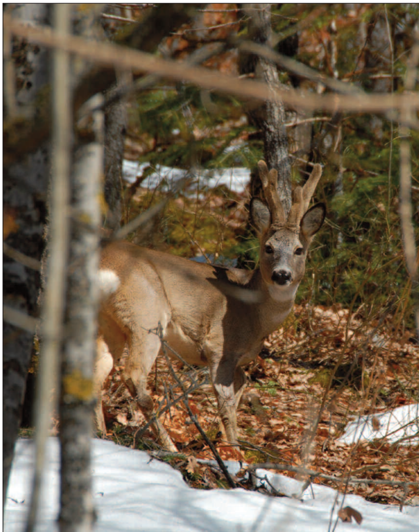
Capriolo in prossimità del lago di Scanno. Loc. “Le Cunicelle”.

Programma sociale Auditorium “Guido Calogero”