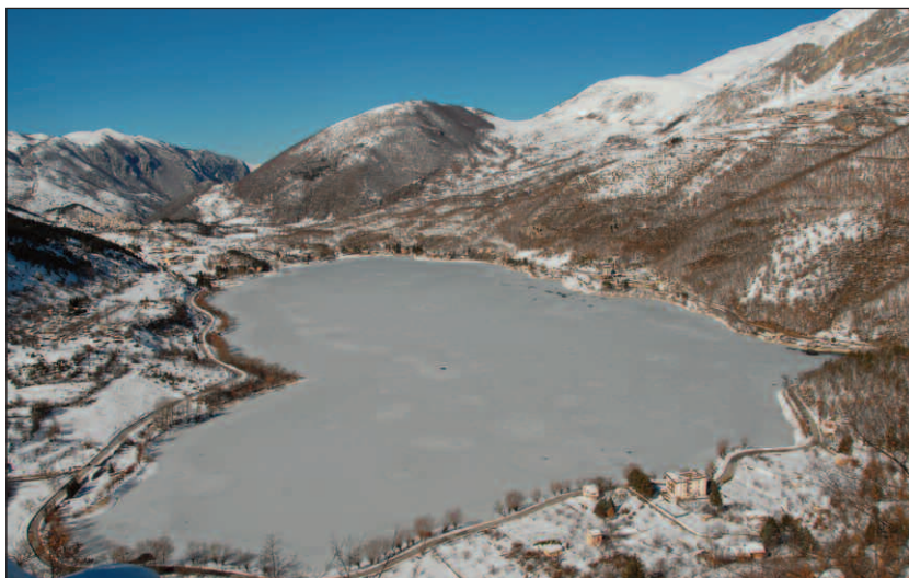
Il lago ghiacciato di Scanno, metà febbraio 2012.