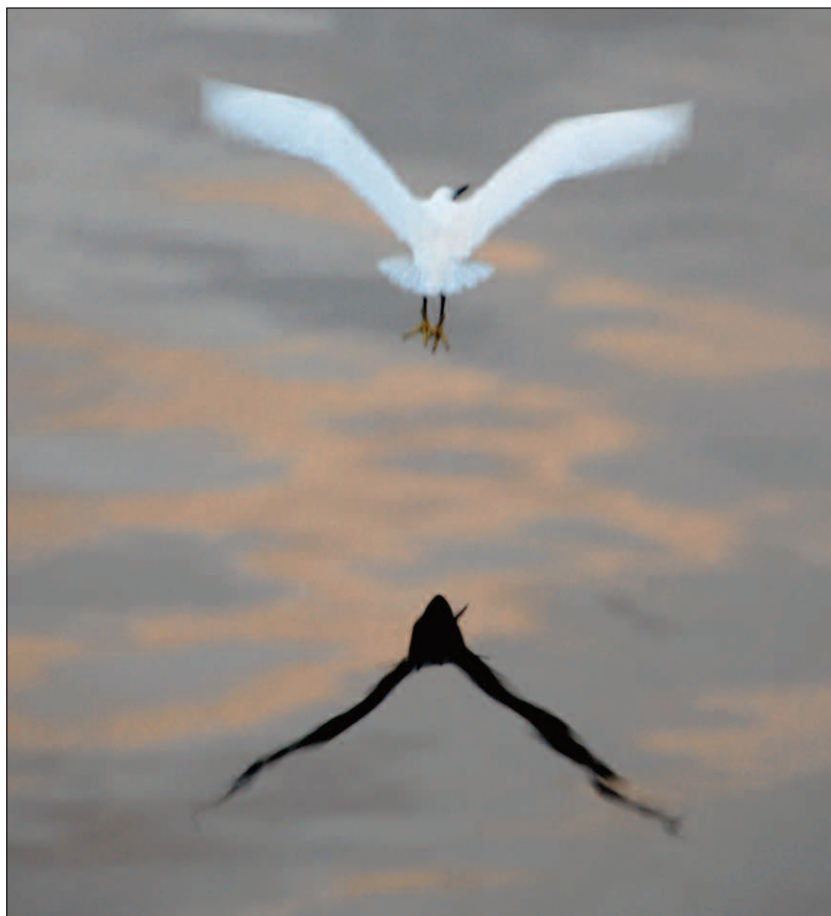
Gioco sulle acque del lago dell' Egretta garzetta .